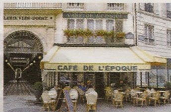
2 e ex-æquo Café de l'Époque.