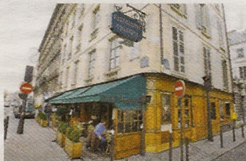
1 er Café Voltaire.