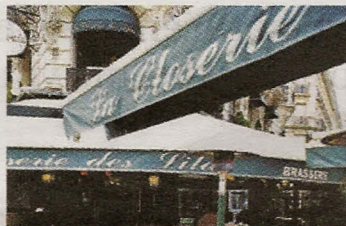
2 e La Closerie des Lilas.